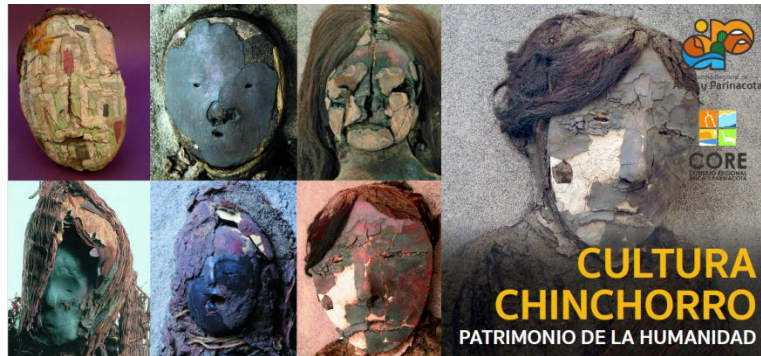
Imagen referencial a escala. Diseño definitivo.