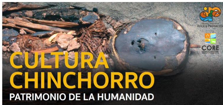
Imagen referencial a escala. Diseño definitivo.